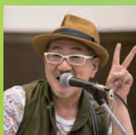
Jackあまの: うたとおしゃべりとギター